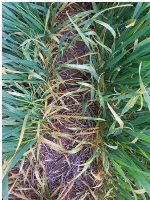
Trichoderma Hz (200 ml/100 kg semilla)