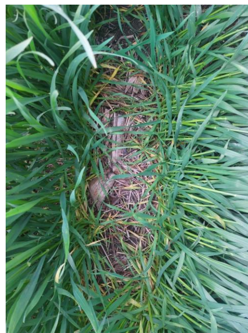
Sistiva® Plus Pack Curasemillas