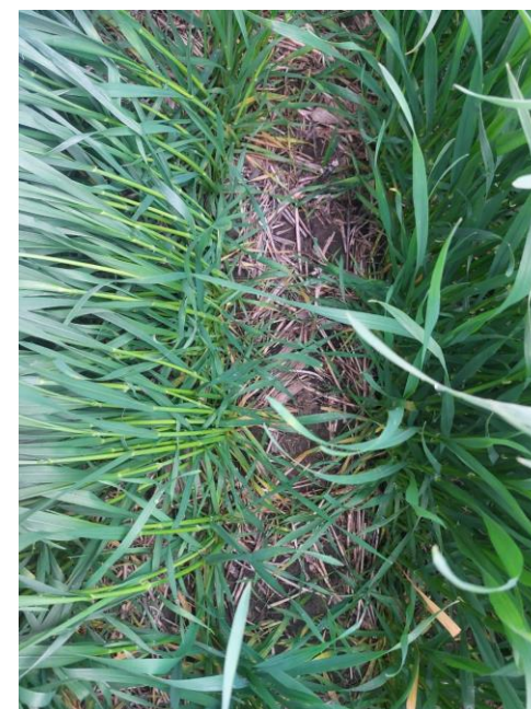
Sistiva® Plus Pack Curasemillas