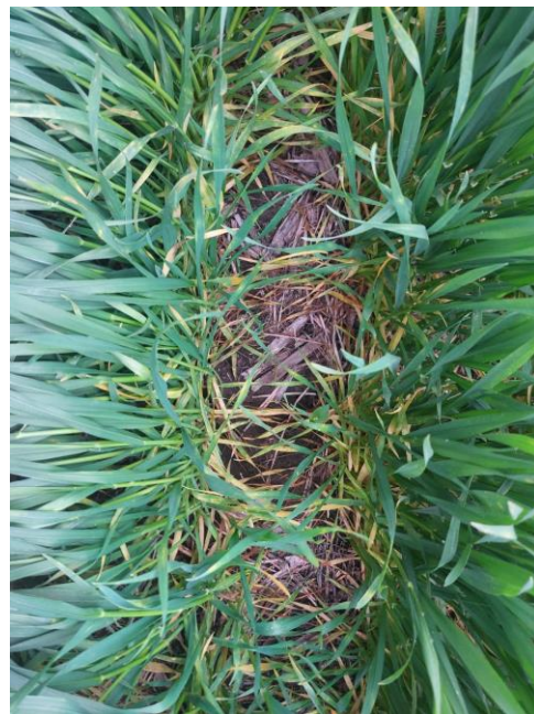
Difenoconazole +Fludioxinil +Sedaxane (250 ml/100 kg semilla)